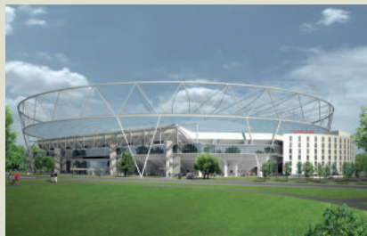
Umbau und Erweiterung BayArena im Sportpark Leverkusen. Baustatische Prüfung. Architektur und Animation: HPP. Bauherr: Bayer 04 Immobilien GmbH.