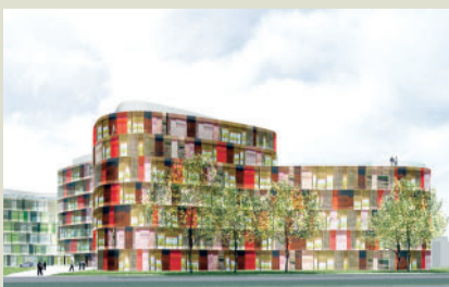
Cologne Oval Offices am Gustav-Heinemann-Ufer, Köln-Bayenthal. Baustatische Prüfung. Architektur und Animation: sauerbruch hutton architekten. Bauherr: MEAG.