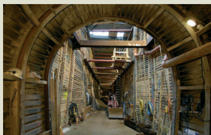
Entwässerung Industriegebiet Köln-Niehl, Kanalbau und Hochwasserpumpwerk. Tragwerksplanung. Bauherr und Foto: Stadtentwässerungsbetriebe Köln AöR.