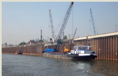
Erweiterung Hafen Godorf, Neubau Hafenbecken IV. Objekt- und Tragwerksplanung, Bauleitung und Bauoberleitung. Bauherr: Häfen und Güterverkehr Köln AG.