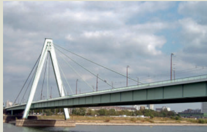
Severinsbrücke, Köln. Sanierungsplanung der Rampen und Landbrücken. Bauherr: Stadt Köln.