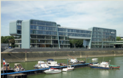
RheinartOffice, Köln. Baustatische Prüfung. Architektur: Freigeber Architekten mit Architekt Stephan Schütt. Bauherr: ArtOffice.