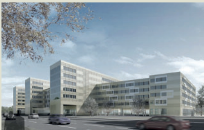
Landesamt für Besoldung und Versorgung NRW, Düsseldorf. Tragwerksplanung. Architektur und Animation: Heine Wischer und Partner. Bauherr: BLB NRW Düsseldorf.