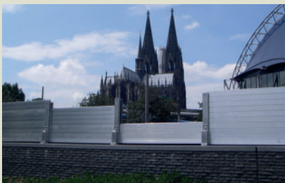
Hochwasserschutz im Bereich der Kölner Altstadt. Objekt- und Tragwerksplanung, Bauleitung und Bauoberleitung. Bauherr: Stadtentwässerungsbetriebe Köln AöR.